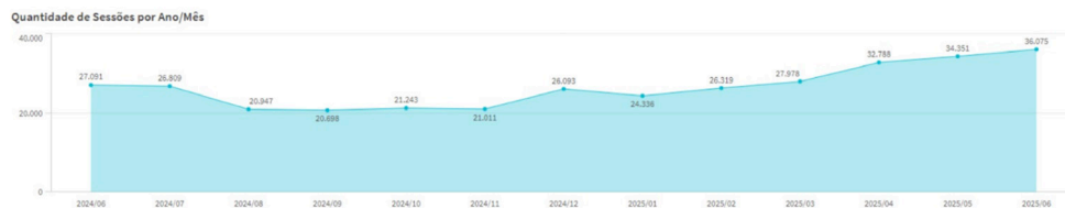
Figura 1 – Evolução do número de acessos à plataforma Transferegov.br

A Plataforma Transferegov.br é um dos instrumentos mais importantes para a consecução desse objetivo. E, conforme divulgado neste mês pelo Ministério da Gestão e da Inovação em Serviços Públicos (MGI), é crescente a sua relevância, tendo sido registrado um aumento de 71% do número de acessos de setembro/2024 a junho/2025: